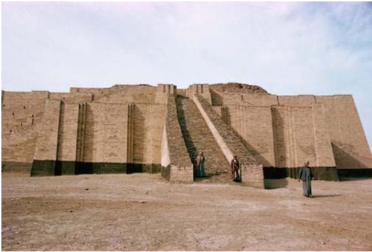
Zigurat de Ur. III milenio a.C.