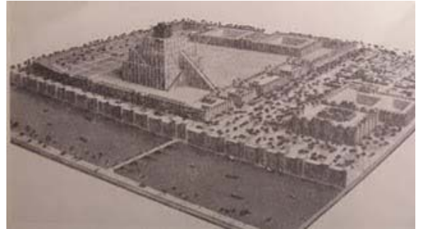
Babilonia. Siglos VII-VI a.C.