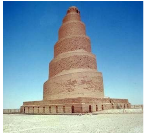
Minarete de la Mezquita de Samarra. Siglo IX d.C.