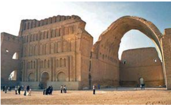
Ctesifonte. Persia sasánida. Siglos III-VII d.C.