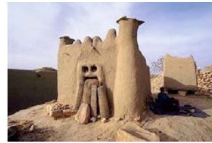
Arquitectura Dogon. Mali