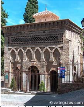
Cristo de la Luz, Toledo. Antigua mezquita. Siglo X . Época califa