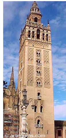
Giralda, Sevilla. Siglo XII. Periodo almohade