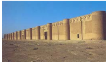
Mezquita de Samarra, Iraq. Siglo IX.