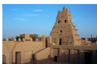
Tombuctú, Mali. Siglos XIV-XVI