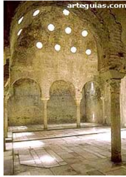
Baños árabes de Granada, siglo XI