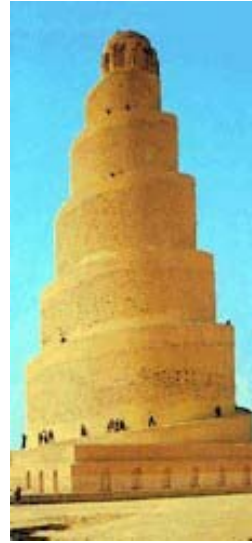
Minarete de la mezquita de Samarra, Iraq, siglo IX