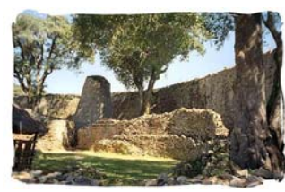
Ciudad Gran Zimbabue. Imperio Monomotapa. Siglos XV-XVII. República de Zimbabue