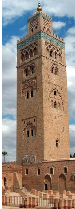
Gran Mezquita de Tremeccé Marruecos. Siglo XI. Periodo almorávide