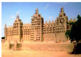
Mezquita de Tombuctú, Mali. Siglo XIV