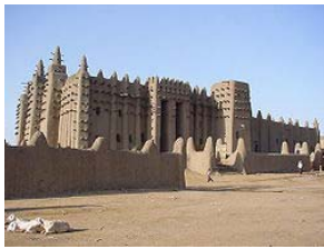
Gran Mezquita de Djené, siglos XII-XIV. Mali. El mayor edificio sagrado en adobe del mundo