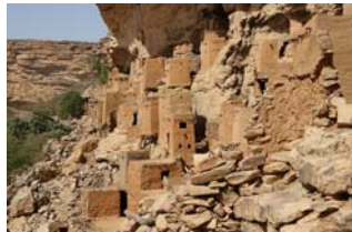
Arquitectura Dogon. Mali