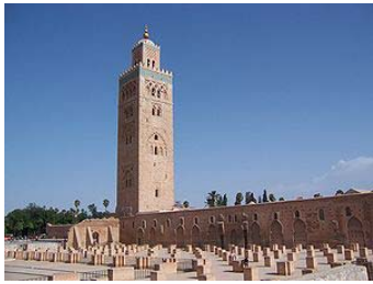
Mezquita Kutubiya, Marrakech. Marruecos. Siglo XII. Periodo almohade