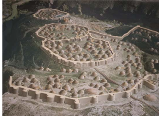
Reconstrucción de Los Millares