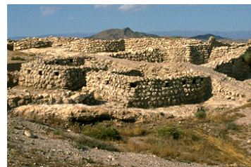
Murallas y cabañas