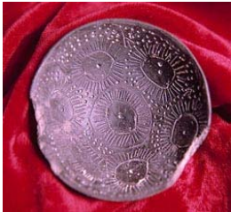
Cerámica de Los Millares