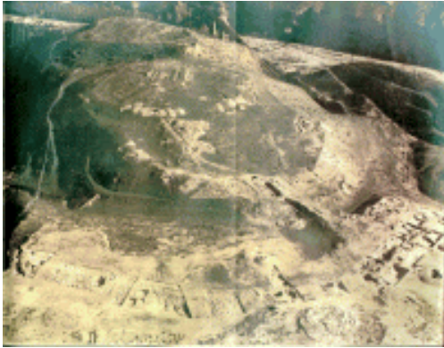
Vista general de Los Millares

En Almería tenemos los restos del poblado de Los Millares, construido y habitado durante la Edad del Cobre. Las investigaciones estiman que fue ocupado desde finales del IV Milenio a.C. Hasta el último cuarto del III Milenio a.C. En él se han encontrado restos de murallas (hechas con adobe y piedras), viviendas, necrópolis, cerámicas, utensilios, etc.