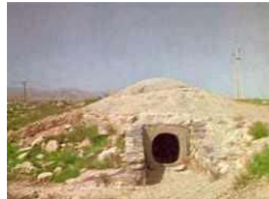
Dolmen 1 de Los Millares