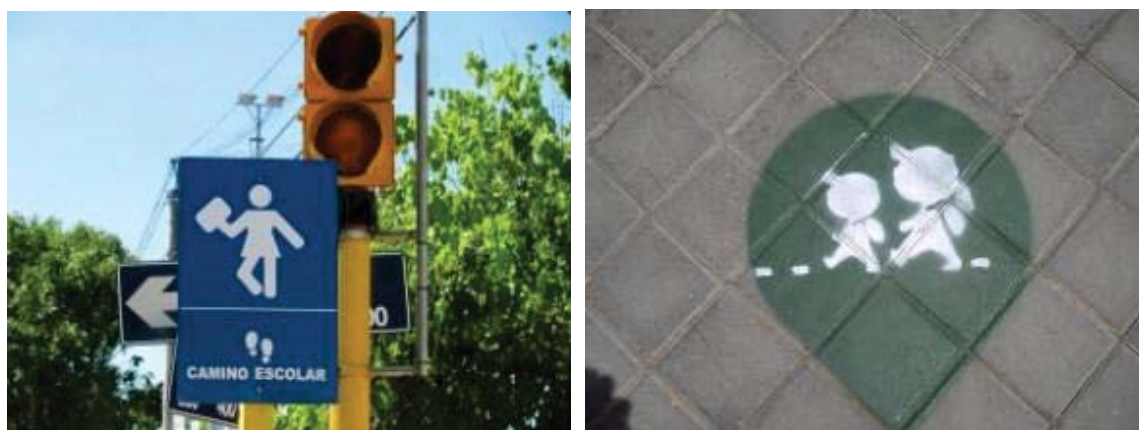
Ilustración 11 Ejemplo de señalización de Caminos Escolares

No menos importante serán las tareas de señalización y orientación en el recorrido del camino escolar, mediante señales de tráfico informativas, señales de limitación de velocidad, indicadores en el pavimento de las aceras que los niños puedan seguir con facilidad, etc.