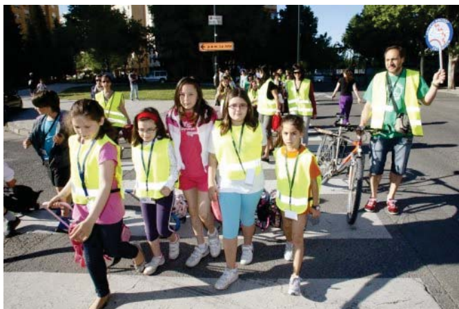
Ilustración 12 Ejemplo de Pedibus