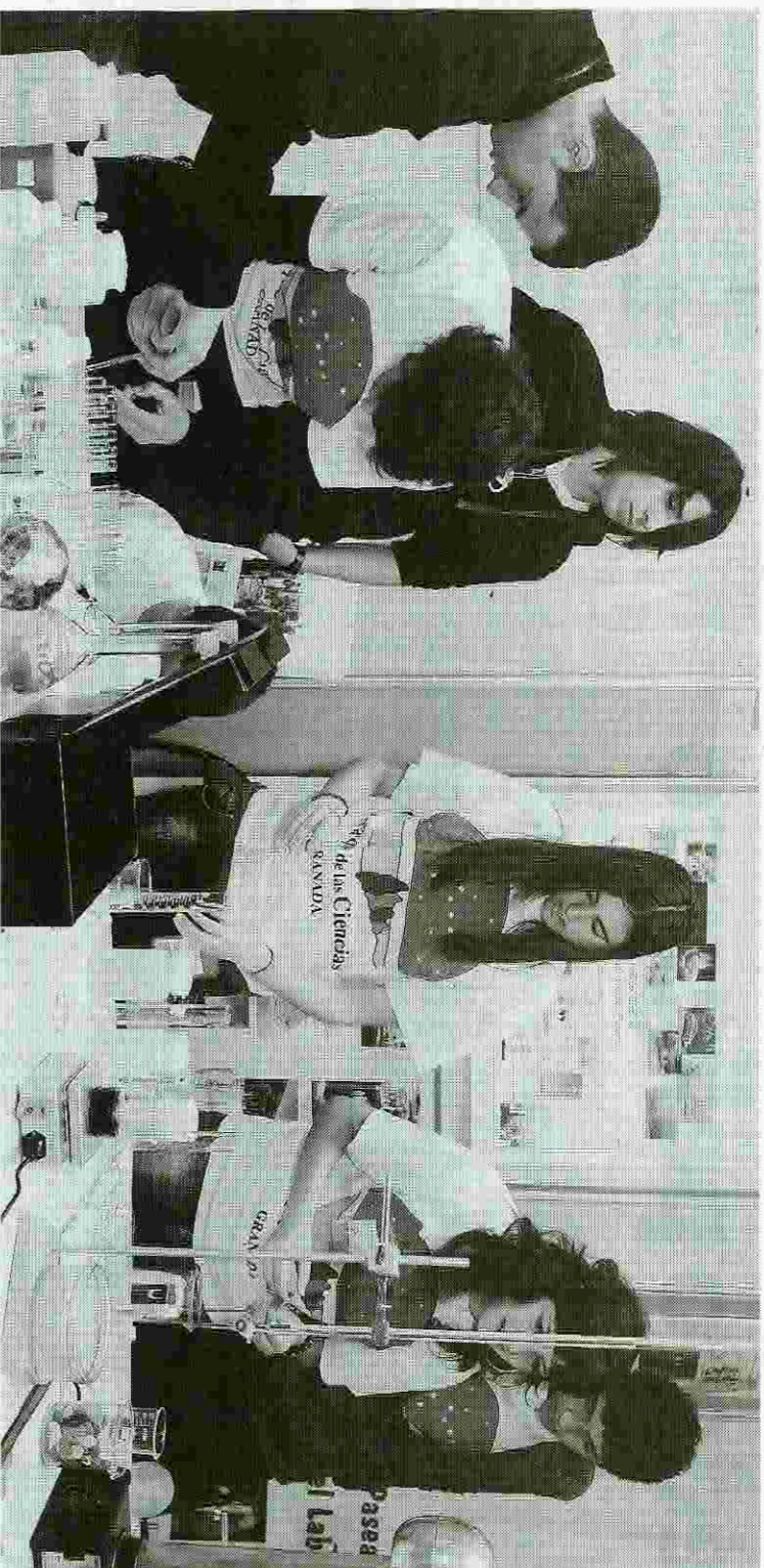
Los visitantes disfrutaron de una jornada muy instructiva.